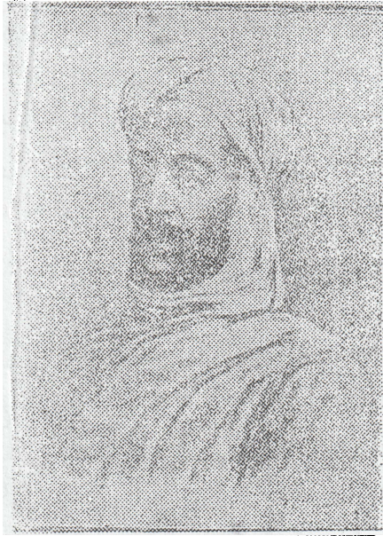
الإمام السيد محمد أحمد المهدي

مرت الأيام وانقضت الشهور والسنون وشاء الله جل جلاله أن تجرى المياه في مجاريها وأن ترد البضاعة الى أهلها وان يرجع حكم السودان المستضعف الى أهالي السودان بعد انقضاء ستين سنة ونيف تحت الحكم المصري التركي بخيره وشره فكان لا بد من القضاء ونظام القضاء شأن كل دولة مستقلة تمام الاستقلال .